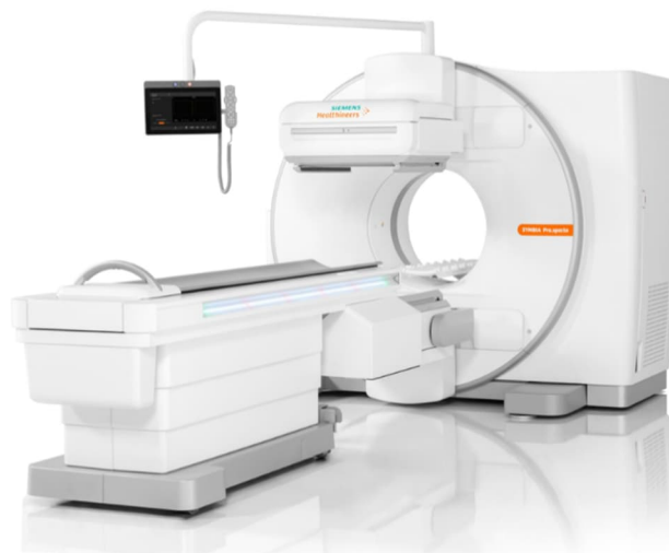
X線CT組合せ型SPECT装置「Symbia Pro.specta」 認証番号：21800BZY10185000