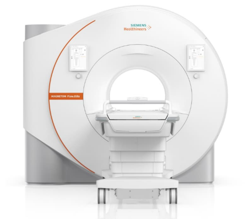
超電導磁石式全身用MR装置「MAGNETOM Flow.Elite」 認証番号：307AABZX00042000