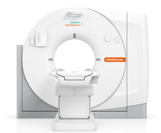
全身用X線CT診断装置「SOMATOM go.Top」 認証番号：230AABZX00028000

※同センターにおける画像診断装置について、診断・治療・臨床研究を目的とした使用は行いません。