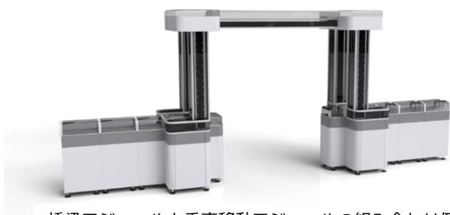
橋梁モジュールと垂直移動モジュールの組み合わせ例

搬送ラインの両側に分析装置や処理モジュールを配置できるレイアウト構造を採用することで、省スペースな運用が可能になり、検査室の限られたスペースを最大限に活用できます。加えて、新たに導入した橋梁モジュールや垂直輸送モジュールにより、上下方向の空間を活用した 3D レイアウトも可能となり、検査室の規模やニーズに応じて柔軟な設計を行うことができます。