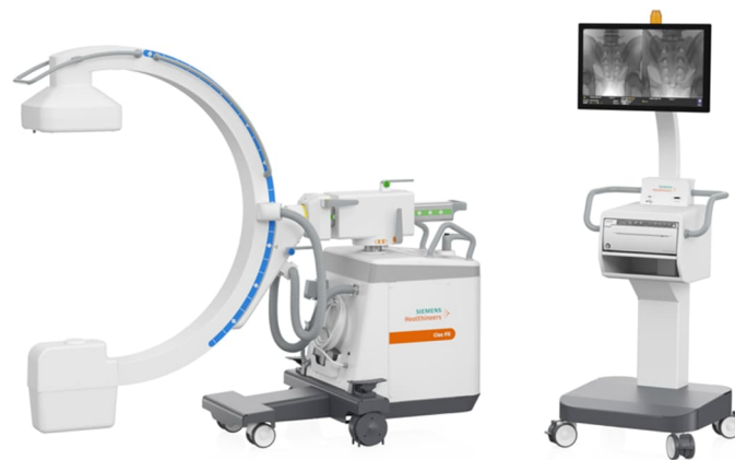
販売名：シオスフィット 認証番号：305AABZX00017000

シーメンスヘルスケア株式会社（東京都品川区、代表取締役社長: 櫻井 悟郎、以下シーメンスヘルスケア）は、整形外科や泌尿器科など幅広い診療科に向け、高画質なイメージングとコストパフォーマンスを両立した、FD 搭載モバイル C アームイメージングシステムのエントリーモデル「Cios Fit FD」（シオス フィット FD）を 4 月 9 日より販売します。