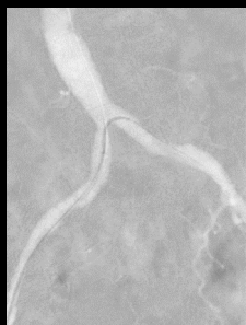
Crossover com o roteiro DSA

Doença oclusiva periférica estágio IV no lado esquerdo devido à reoclusão da artéria femoral superficial.