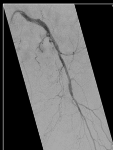
Exploração da artéria ilíaca externa esquerda com DSA

DSA Roadmap sobrepõe imagens DSA existentes na fluoroscopia ao vivo, orientando procedimentos sem reinjetar contraste.